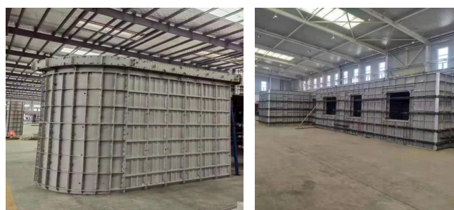
（a）弧形结构部位拼装效果图 （b）内墙试拼装效果图

根据BIM技术优化的铝合金模板在安装前，需要进行试拼装，试拼需要检查模板的强度、刚度、截面尺寸，高程、连接点能否达到方案设计要求，当满足预期方案相应要求方可出厂运送现场安装。出厂前拼装效果见图2。