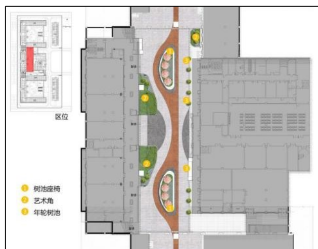
图7 海棠园景观总平面图

海棠园取自“海棠不惜胭脂色，独立蒙蒙细雨中”，置身其中，无不为海棠优雅脱俗的美所陶醉，寓意高尚的品格和风骨，庭院内设置树池座椅、艺术角、年轮树池等景观节点（如图7），树池中栽种北美海棠和紫穗狼尾草，营造出特色景观庭院，在建筑入口两侧种植大叶女贞、造型女贞、小兔子狼尾草、鸢尾等，结合景观石，打造精致的花境景观，景观小品风格现代简洁，符合校园氛围，便于将学习从课堂转向室外，传递出学校开放包容的气息。