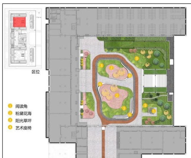
图5 枫树园景观总平面图

花”，展现了一幅动人的校园秋色图，体现了山大学子豪爽向上的精神，庭院内设计阅读角、粉黛花海、阳光草坪、艺术座椅等景观节点（如图5），庭院中心以粉黛乱子草和开敞的草坪为主，在草坪上，以丛生元宝枫形成孤植方式，构成开敞的互动空间，同时在下沉庭院大台阶两侧，以雪松、云杉、丛生朴树、红叶李、淡竹、腊梅、红叶石楠球、大叶黄杨球、细叶麦冬等乔灌木搭配形成群植空间。中心开敞空间和两侧树群相结合，主次分明，疏密有致，层次饱满，色彩与芳香相结合，赏心悦目，沁人心脾。