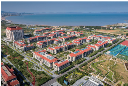
图1 山东大学青岛校区局部鸟瞰图

本文以山东大学青岛校区学生公寓B1、B2、B5、B9、B10及学生食堂B6项目室外景观设计为例,设计充分尊重校园整体规划(如图1),对项目区位和现状进行分析,以人性化设计为原则,将学生的需求作为出发点,力求打造一个基于学生需求和行为特征的庭院景观,营造一个真正与学生相契合的宜人场所,达到建筑与景观相融合,充分实现校园的人文价值。