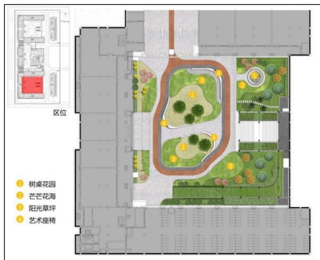
图6 乌柏园景观总平面图

乌柏园取自“巾子峰头乌柏树，微霜未落已先红”，乌柏的红如同山水画中的胭脂，一点一点地晕染开来，深深浅浅，绚烂无比，正如山大学子生机勃勃，恰到好处的性情，庭院内设计树桌花园、茫茫花海、阳光草坪、艺术座椅等景观节点（如图6），庭院中心以细叶芒和开敞的草坪为主，在草坪上，以丛生乌柏形成