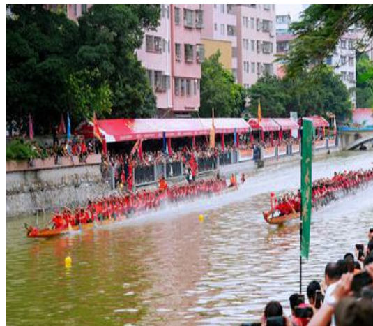
图4 车陂涌整治后实景

“水清岸绿、鱼翔浅底”的生态景象，市民获得感和幸福感显著提升（车陂涌整治后实景图见图4）。