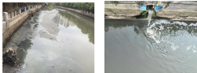
图2 车陂涌治理前现场图片

情况。经统计，车陂涌主涌约有150个问题排口，存在旱季污水直排河涌的情况。同时，由于河涌流域范围较广，排水主体大部分为混流制，分流制单元也存在大量的错混接，导致污水通过雨水系统排入河涌。经计算，流域内日污水量为18.3万吨，其中每天约有9万吨的污水通过排污口以及溢流口排入河涌，远远超出河涌自净能力，导致水质变差。此外，污水管网结构性病害和功能性病害问题突出，管网堵塞、断头等情况较多，严重影响片区污水收集。