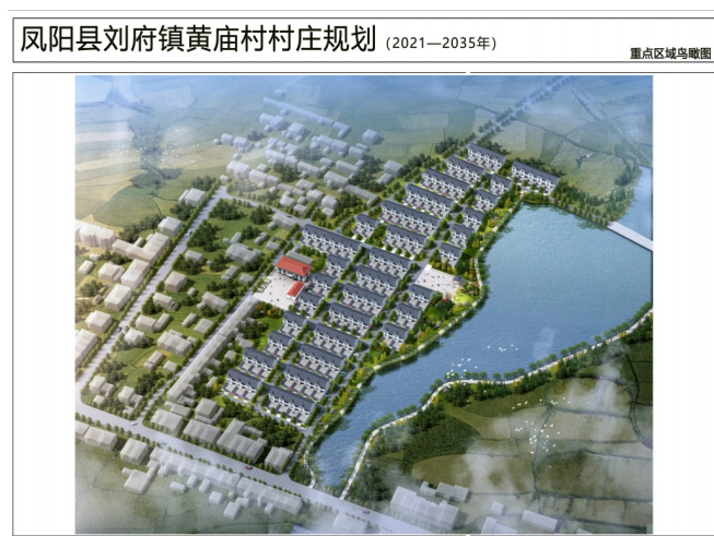
图3 凤阳县刘府镇黄庙村村庄规划 - 重点区域鸟瞰图