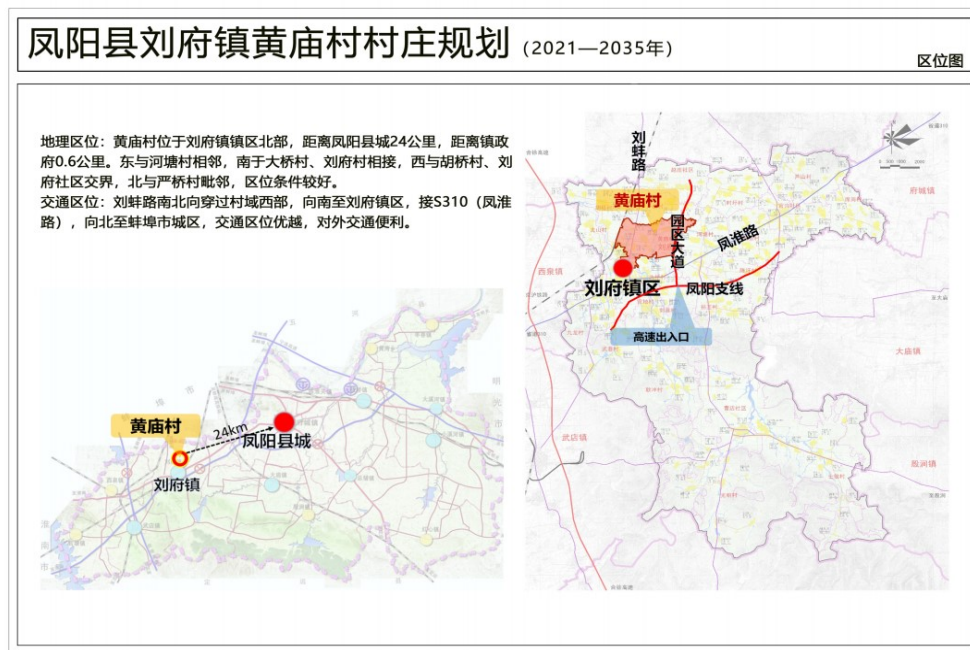
图1 凤阳县刘府镇黄庙村村庄规划区位图

在实用性村庄规划中，产业发展规划的目标和方向是非常重要的。通过引入现代农业技术和管理模式，提高农业生产效率和农产品质量，增加农民收入，提升农业的竞争力，促进农业现代化。利用乡村的资源优势，如自然风光、传统文化、特色手工艺等，发展乡村旅游，为村民创造更多就业机会，同时带动相关产业的发展，发展乡村旅游。根据市场需求和当地资源条件，积极培育新兴产业，如生态环保、健康养生、文化创意等，增加村庄的经济增长点，培育新兴产业。促进农业与二、三产业的融合发展，形成产业链条，提高产业的附加值，例如，将农产品加工、销售与电商、物流