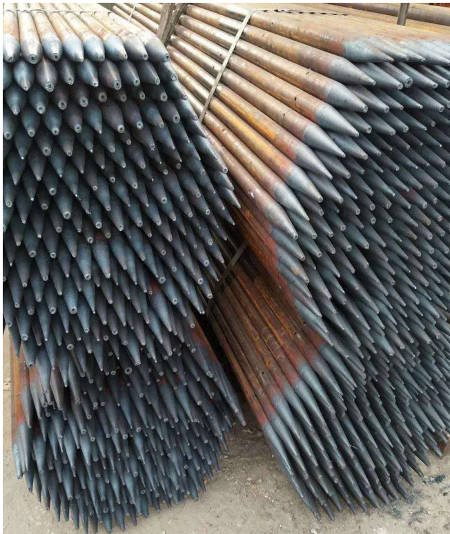
图1 常见无缝注浆管

为确保注浆管在使用过程中的稳定性以及长期使用的耐久性，通常将无缝钢管以及镀锌管作为注浆管的主要材料，管径一般为25~30毫米。制作注浆管期间，需要预先对管内的摩擦阻力予以全面考虑，联系设置的注浆压力从而制定便利且科学的注浆管制作方案，可以将注浆管分为主管、花管以及扣接头等不同部分，分期制作能够保证注浆管使用的整体质量。以花管为例，根据施工的实际要求设置形状为梅花的出浆孔，孔径的大小需进行预先控制，通常为6~7毫米左右，从而确保注浆排出的顺畅性 [7] 。此外，为避免出现后续的水泥浆液渗漏问题，要求使用橡胶膜或塑料膜预先包裹花管，并使用铁丝进行绑扎处理，从而保证注浆质量。图1为常见的无缝注浆管。