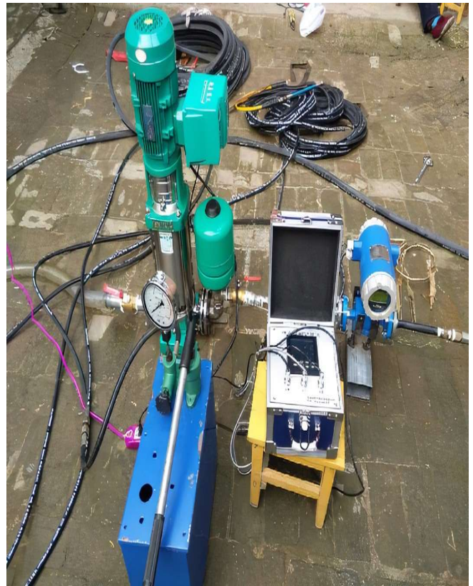
图2 常见压水试验系统

量的重要基础，开展压水试验的时间一般在完成所有灌注桩浇筑任务的5天内。压水试验需要提高对单向阀以及注浆管路等关键部件使用通畅性的重视，为避免出现单向阀堵塞问题，要求保证周边杂物清理的及时性与全面性。为避免出现结构坍塌等问题，需确保压水试验获取数据的精准性，最佳的时间是在灌注桩浇筑施工前，确保本身较厚的混凝土覆盖层结构能够在压水试验过程中被及时冲开 [8] 。同时为确保整体试验开展的有效性，要求在试验期间派遣专业人员展开对冲破压力值等关键指标的记录工作，确保能够基于试验结果判断注浆质量，为后续施工进程的顺利推进提供关键参考。压水试验过程中，需要确保注浆管路获得持续的高压水注入条件，时间一般为3~5分钟。同时需要在试验过程中提高对高压水压力变化状态的重视，要求应将水压始终控制在0.5~1兆帕这一范围内。图2为压水试验过程中经常使用的试验系统。