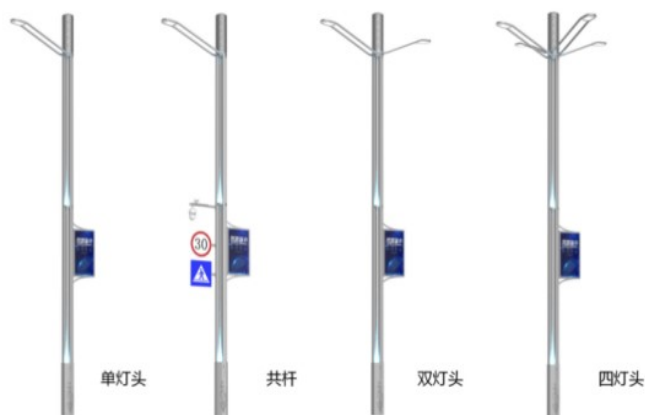
图1 产品效果图 a

②系统集成智能化的安装系统，对整个系统进行智能化的监控，有应急设施，具体组成可见图2。