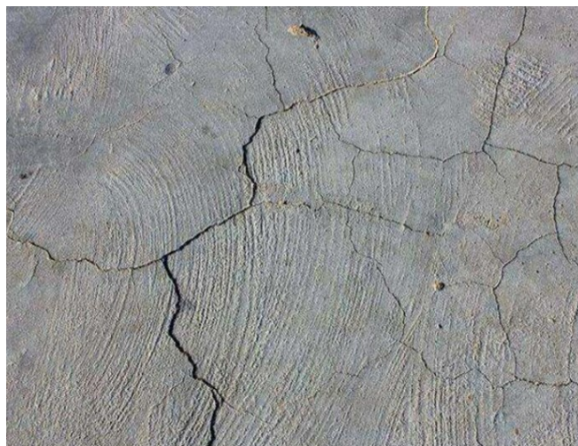
图1 混凝土收缩裂缝

发过快造成。因作用原理不同，收缩裂缝也分为干燥收缩裂缝、自收缩裂缝等种类。在建筑工程实施环节，周边温度较高、内部水分快速流失，会出现干燥裂缝；干燥裂缝就是硬化时的自然收缩，内部水分流失，混凝土体积收缩，出现裂缝的情况。