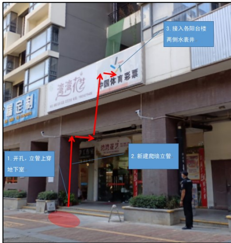
图3 绕开一楼商铺新建管道