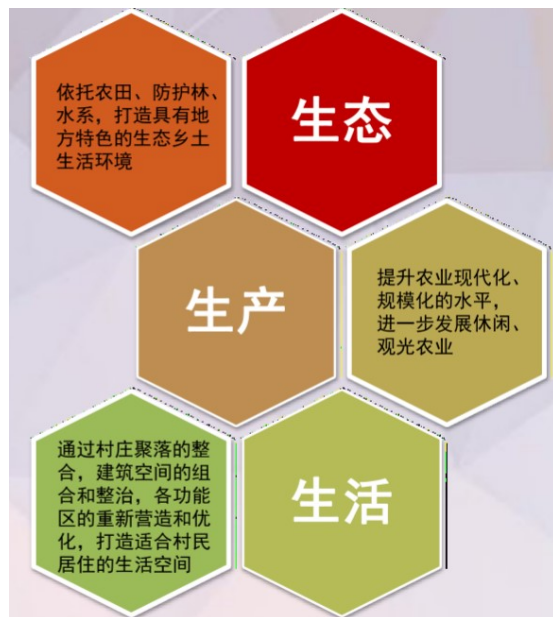
图1 农村土地规划目标