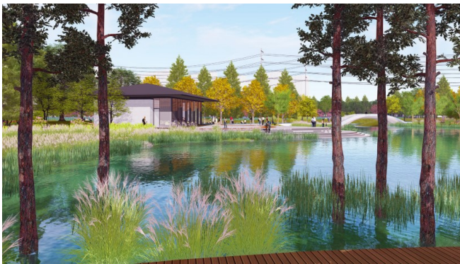
图2 茶室与亲水广场

对于龙泉港公园“水岸”的设计建造，将以人为本的可持续发展理念充分融入进去，在塑造城市良好风貌的同时，也对周边的生态平衡和居民生活质量进行了有效改善。在这一过程中，龙泉港公园的建造采用了生态修复手法，修复了受损的水岸生态系统，对生态环境的改善和水质的改造提供了重要支持。而且结合周边居民的实际需求，设置了休闲设施和亲水空间，使居民的生活质量得到进一步提升。比如，亲水广场与水岸茶室相结合，充分考虑公园的后续运营与人气聚集；同时建筑与水面相映，兼顾日夜景，丰富视觉观感。