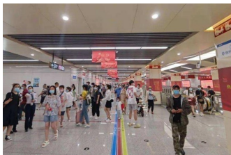
图1 火车站换乘引导

地铁空间的照明、色彩都趋于一致，由于地下没有很多标志物，乘客身在其中定位困难。而作为换乘站，彭城广场站没有像徐州火车站站一样用引导线引导人们出站和换乘，仅仅是在两站交界处做了标识牌（图1，图2）。按照视知觉地表优势理论，视觉系统能更有效的表征眼高水平线以下的视觉空间。人们对视平线以下的空间中物体的定位与视平线以上空间相比也更为准确 [4] 。所以当标识牌只存在于换成电梯上方时，很容易被乘客们忽略。且彭城广场站经常出现在1号线检票区域指示二号线位置的情况，标识密集，较难分辨。