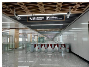
图5 闸机口引导标识