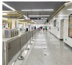
图2 彭城广场站换乘引导