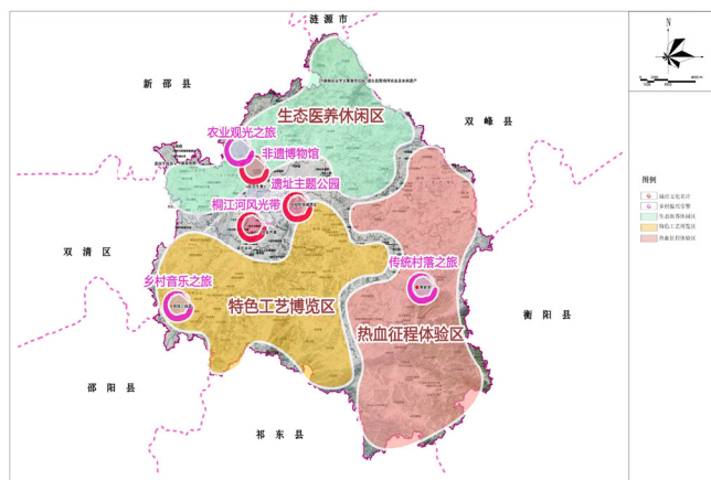
图2 市域文化遗产利用示意图

产、优质、高效与持续发展”的发展目标，达到经济效益、生态效益、社会效益的协调统一，主要包括铁皮石斛种植基地、金银花基地等，打造集园林观光、健身养老、休闲垂钓、生态养殖、有机果蔬种植于一体的农业观光之旅。