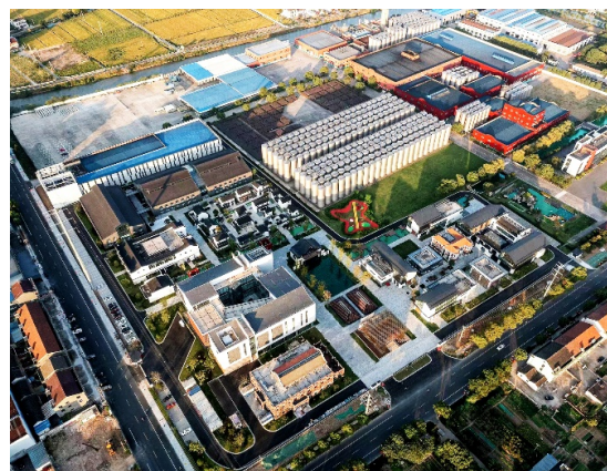
图2 黄酒文化园鸟瞰图