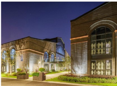
图3 沿酒香路看向黄酒储存楼BF