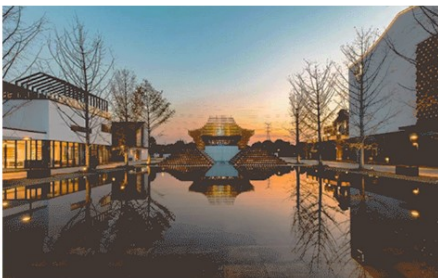
图7 从戏台H看向“千泉”和门楼