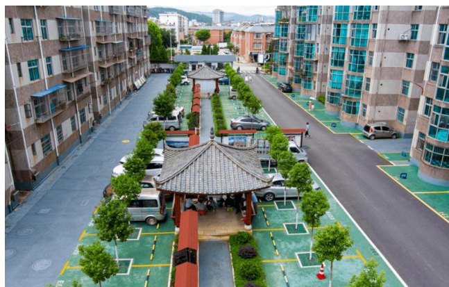
图一 改造后的道路

提升城中村环境质量的核心在于全面改善公共设施与福利设施，包括基础设施如供水、供电、排污设施，与服务设施如公共绿化、体育、卫生及教育资源。以此作为基础，可提升居民生活质量，优化社区景观，提高城中村活力如图一所示。在城中村治理规划与实施过程中，应着重考虑居民的民生需求，尤其是经济、社会及文化需求。通过深度调查与居民积极参与，我们可以精确了解住房改善、就业机会、教育培训、医疗卫生等方面的居民需求。根据这些需求，可以制定相应的规划和政策，解决民众关切的生活问题，进一步提升居民满意度与幸福感。