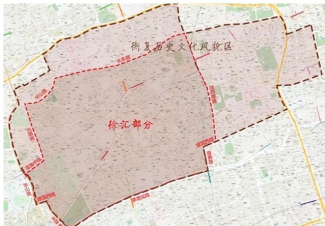
图1：上海市衡复风貌区

由于城市更新的影响因素较多，因此在历史文化利用方面要不断的革新思维，坚持通过历史文化创造出新的价值，这样才能在未来的城市更新建设上得到较多的保障。