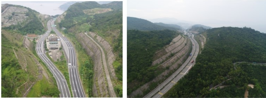
溪涌检查站路段现状纵断面情况