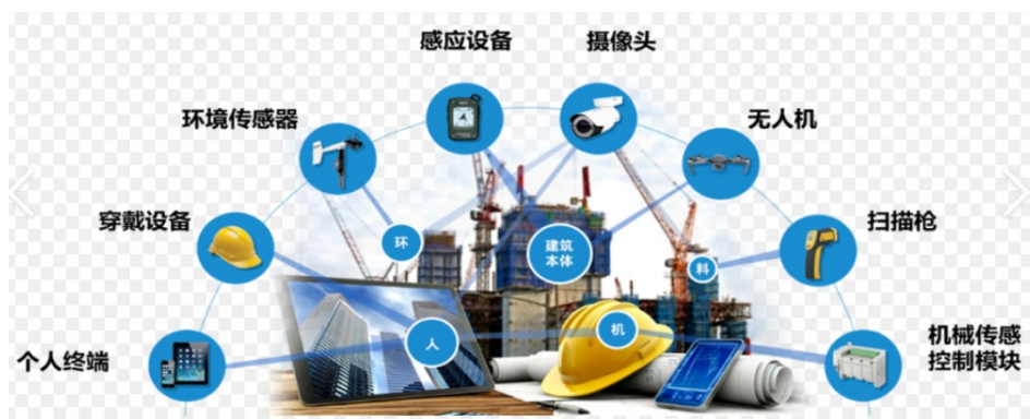
图 2: 智慧工地应用场景

术，可以实现对工人的行为和作业环境的实时监测，及时预警和干预，提高工地安全管理水平，减少事故发生。大数据分析可以帮助建筑公司实现可视化的建筑管理。通过对建筑数据的整合和分析，可以实现对建筑项目各个环节的可视化监控和管理，帮助管理团队更好地理解项目进展和问题，及时调整和优化决策，提高项目管理效率。综上所述，大数据在建筑工程领域具有巨大的潜力，可以帮助建筑公司实现智能施工管理、预测性维护、建筑设计优化、工地安全管理和可视化建筑管理，全面提升建筑工程的效率、安全性和可持续性。如图2