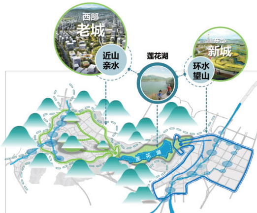
图1 鲁沙尔城市空间结构

统筹周边山岭形成八莲聚谷，依托绿谷围合地形构建两城向湖打造“八莲聚谷，两城向湖”。