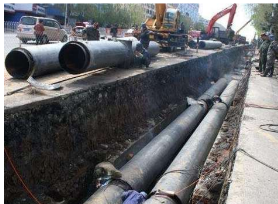
图1 某市政工程给排水安装图（局部）