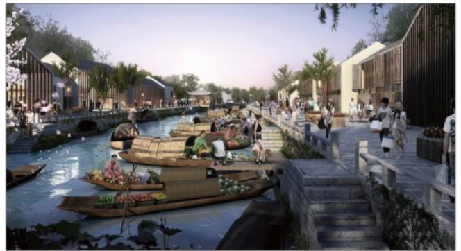
图2 新场水上集市效果图

里打造为传统的江南水乡，不仅有独具特色的水上集市（如图2），还引进了一系列文化娱乐休闲产业，在保护古镇原有风貌的同时还有效促进了当地旅游业的发展。