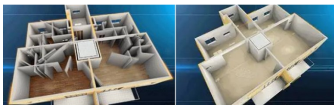
图2 某建筑剪力墙结构优化设计前后效果比较

设计人员在明确建筑结构类型后，应该对抗震性、承载力等进行均衡设计，确保上部结构及地基区域的设计标准与整体设计规范吻合。同时，设计人员也要根据实际情况优化局部结构的稳定性、安全性。比如：针对绿色建筑的钢框架结构，在具体设计过程中，内部设计的阳台、卧室等结构在设计方面，与建筑整体结构的环保设计要求吻合，并对二者之间的关系科学处理。同时，设计人员也要对局部结构进行优化设计。以剪力墙为例，某建筑的户型空间面积小，为达到对空间扩大的目的，设计人员采取建筑结构设计优化方法，先对剪力墙承载的作用深入分析，了解剪力墙的分布是否均匀。其次，对剪力墙的其他性能展开研究与剖析。诸如外延性等。最后，围绕整体设计的要求与标准，对局部区域的结构进行优化设计与改造，取消框架墙，由此达到户型跨度空间增大的效果，具体如图2所示为剪力墙优化设计前后的效果。通过对这种方法的合理应用，整个建筑结构设计的效果不仅能够提高，建筑各功能需求也能得到满足。