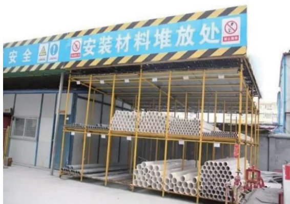
图1 施工材料现场堆放场地准备

的辅助设施，技术人员应该注重进行准确搭设，促使其在保障自身稳定性的基础上，可以较好服务于后续相关作业项目。具体到高边坡支护脚手架搭设中，技术人员需要严格控制所用材料，促使所有钢管、扣件以及其他辅助材料符合施工要求，能够在力学性能以及尺寸型号方面具备理想应用条件，严禁随意运用受损或者是型号不匹配的材料进行脚手架搭设。根据不同高边坡支护施工作业要求，技术人员应该恰当选择脚手架搭设方案，以便促使脚手架可以在保障自身稳固的同时，有效支持各项支护操作，为施工作业人员提供有利条件。比如本项目就按照高边坡支护施工要求，确定了落地式双排扣件式钢管脚手架搭设方案（如下图2所示），沿着高边坡坡面进行逐步搭设，确保脚手架得以形成平整夯实效果，避免在稳定性或者承载力方面存在问题。为了较好确保脚手架的应用效果，技术人员应该重点控制好各个施工参数，尤其是对于脚手架结构中各个钢管的布置，能够确保其间距、高度以及入岩深度等得到严格把控，符合施工图纸的要求。比如针对脚手架中的拉结杆，在确保其打入边坡岩体30cm后，还应该借助于水泥砂浆进行锚固，确保其外露部分也能够达到30cm，并且可以和立杆进行稳定连接。针对脚手架搭设中的剪刀撑以及横向斜撑，技术人员也应该注重进行严格把控，促使其可以较好作用于脚手架体系，能够发挥出较为理想的稳定性保障作用。