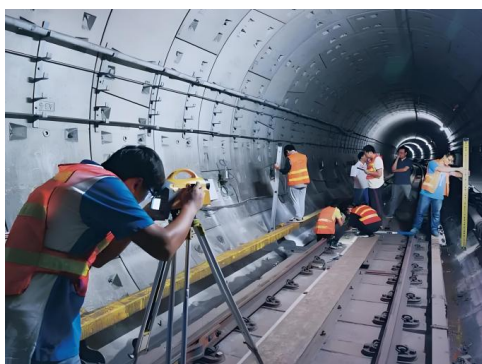
图2 射线检测施工图

在桥梁隧道质量检测领域，射线检测技术依托射线在穿透不同物质时产生的衰减效应，揭示出结构内部的详细状况。当射线穿越不同物质层时，其强度会随物质密度、厚度及射线性质的差异而有所衰减，这种变化为检测人员提供了洞察结构内部状况的线索。X射线因具备卓越的穿透能力，在桥梁隧道检测领域中被广泛应用。它能够轻松穿透厚度高达40cm的混凝土结构，并清晰地呈现出其内部结构细节，为探测团队精确识别和定位潜在问题区域提供了有力支持，为后续的维修工作打下了坚实基础。但传统的射线检测技术也存在一定限制。为了获取全面的检测数据，常需在多个位置部署探测设备，这增加了操作的复杂性和经济投入。另外，在面对特别厚重或结构复杂的区域时，射线可能难以完全穿透，从而影响检测结果的准确性。同时，设备的使用和维护成本相对较高，这也对技术的广泛推广构成了一定限制。近年来，随着科技的不断进步，新型射线检测技术应运而生。例如，借助高性能探测器的工业CT技术，显著提升了检测的准确性。该技术利用旋转的探测设备和探测器阵列，捕获检测对象的三维图像，从而精准地定位和量化评估缺陷。