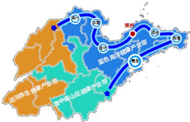
图二 蓝色海洋健康产业带位置图

3. 产业体系：形成以生态为本底，文教体康融合发展的产业发展路径。构建以文教为核心营造品牌，以体育为特色激发活力，以康养为载体提升品质，“三大产业支撑，六大板块融合”的产业体系。