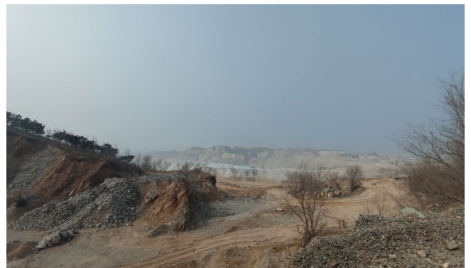
图一 基地现状照片

针对现状存在问题,提出“生态修复、产业升级、品质提升”等三大方面的核心议题。议题一:生态时代如何修复粉子山生态环境,打造莱州高质量发展的生态城市样板?议题二:产业升级如何立足自身衔接主城与滨海,成为莱州多元产业并重发展的重要引擎?议题三:以人民为中心如何提升城市宜居生活品质,塑造莱州主城现代化的城市活力新中心?