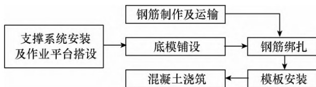
图2 盖梁施工工艺流程