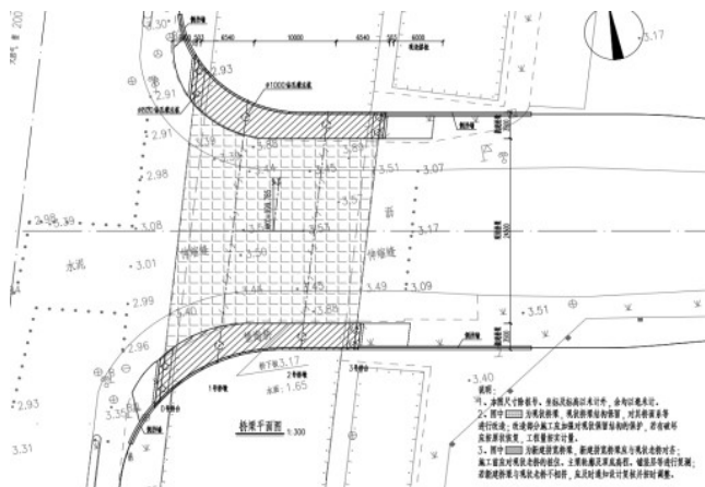
图1 桥梁平面布置图

本工程在现状望海桥位于通港路跨宏远河处, 桥位处河道宽15m。现状桥梁为(6.5+10+6.5)m的现浇连续板结构, 桥梁标准横断面宽24m。为保证现状交通畅通, 同时节约工程造价, 设计考虑现状桥梁结构保留; 并根据道路总体设计, 在现状桥梁两侧新建拼宽桥梁, 新建桥梁面积: 200m 2 , 改造后桥梁标准横断面宽31m。本工程现浇梁板为3跨, 分南北两幅, 每幅长度23m。北幅宽度由东到西从3.5m渐变到5.9m, 标准段板厚50cm, 渐变段板厚80cm; 南幅宽度由东到西从3.5m渐变到6.4m, 标准段板厚50cm, 渐变段板厚80cm。