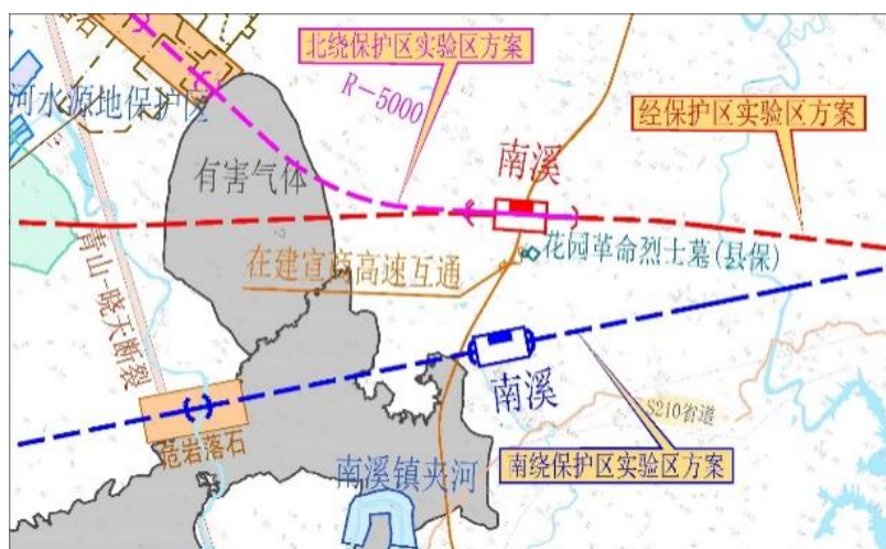
图3 不同方案南溪站设站示意图

方案I与方案III南溪站位于S331省道西侧，在建宣商高速规划互通北侧，符合城市规划，方便群众出行，发挥高铁车站对大别山红色地区经济带动作用。方案II