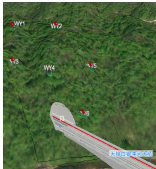
图2 方案II隧道进出口危岩落石分布示意图