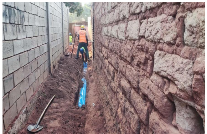
图2 现场局部施工困难区域

项目建设工程位于南隆达省省会城市邵里木，由于该地区的历史和经济原因，区域内人口较多、道路狭窄、交通困难，大型机械和物资进场施工难度大，极大制约了整体工程的施工进度。尤其是阀门井施工中的混凝土供应，仅能通过小装载机进行多次往返运输，工程施工效率较低。因此，可通过合理优化技术组合和施工流程来对施工区域受限问题进行平衡，提高前期施工效率，降低施工成本和风险。