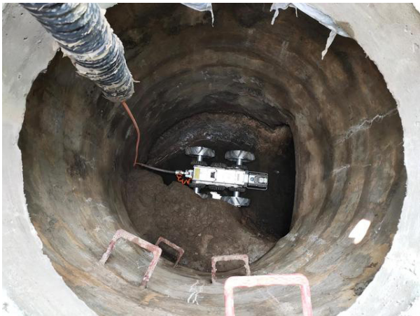
图1 机器人手杆潜望检测

因其操作简便、检测效果好、对管道无损伤等诸多优点，管道内窥检测技术已在市政给排水管道检测中得到了广泛应用，成为保障城市管道安全、畅通的重要技术支撑。