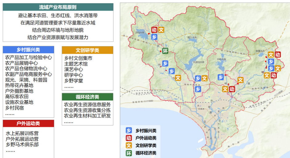
图3 三亚河流域产业布局分析图

(2) 挖掘区域文化要素：挖掘区域文化资源，发展文旅、文创产业基地，提供展览、演出、创意工坊等文化空间，吸引艺术家、文化从业者和爱好者参与。促进文化产业与其他产业融合，鼓励文化要素融入与旅游、餐饮、娱乐等产业的融合发展，推动文化资源的利用与宣传。