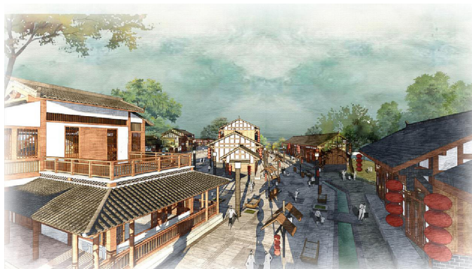
图3 三国文化主题公园设计

例如,在某书香名城的街旁绿地设计中,设计师将阅读文化元素巧妙融入园林景观,绿地入口设置一组大型书卷雕塑,寓意知识传承,与城市的文化定位相呼应,雕塑采用不锈钢镜面材质,与周围苍翠绿意形成鲜明对比,传统与现代和谐统一,景墙以宣纸为背景,镌刻名