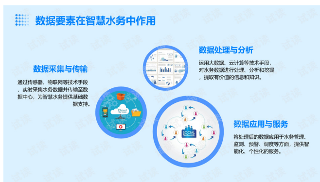
图 2 云计算平台为给排水系统

基于云计算的给排水系统数据分析与远程管理，推动了建筑给排水系统的智能化、自动化与高效运营。传统的给排水系统管理模式通常依赖于人工巡检和现场操作，无法实时处理海量数据，且响应速度较慢，容易出现故障隐患或资源浪费。云计算平台为给排水系统提供了强大的数据存储与处理能力。通过在各个监测点安装传感器采集水流量、水压、水质等关键数据，这些数据实时传输到云端进行集中存储。传统的本地存储方式可能由于存储设备的限制，无法有效处理大规模的实时数据，而云计算则能够利用其分布式存储技术，高效、稳定地处理并存储大量数据。如图 2 所示。