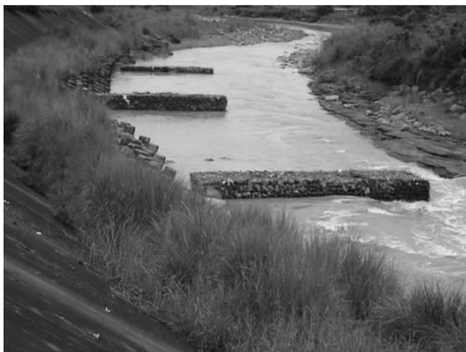
图1 坝式护岸结构图

坝式护岸是水利工程建设过程中常见的一种技术方式，主要利用滩岸修筑的顺坝和丁坝进行有效结合构成护岸坝，对水流的方向进行引导，降低水流对堤岸产生的侵蚀和冲刷，达到堤岸安全性的保护需求（如图1）。当前大部分坝式护岸采用丁坝结构，采用具有特殊功能的防水材料，达到堤岸侵蚀保护的效果。在丁坝护岸施工期间，基本选择五绞格网网箱结构，辅助利用具有较强抗腐蚀性和耐磨程度以及强度较高的低碳高镀锌丝对网箱进行制作，并将特定规格的石料填入到网箱内部，达到堤坝滩岸固定的效果，实现挡水和降低侵蚀的作用。