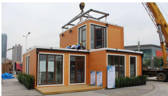
图2 模块化建筑结构的施工图

模块化施工流程的应用指南应包括以下几个方面。第一，选址和设计需同步进行，根据地理位置和用途确定模块化设计方案 [4] 。第二，精确的工厂预制与现场勘测相结合，确保预制组件的精度和适配性。第三，严格的质量控制和标准化生产流程，通过工厂预制、运输和现场安装等环节的无缝衔接，提升施工效率。第四，应用先进的BIM技术（建筑信息模型）进行施工计划和进度管理，实现对施工全过程的实时监控和调整。