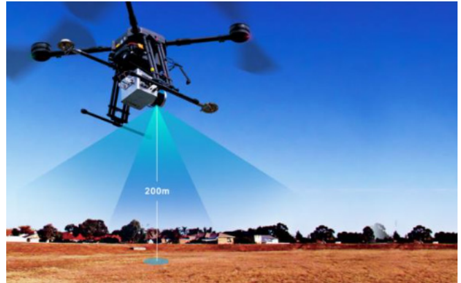
图 1：单光子激光技术