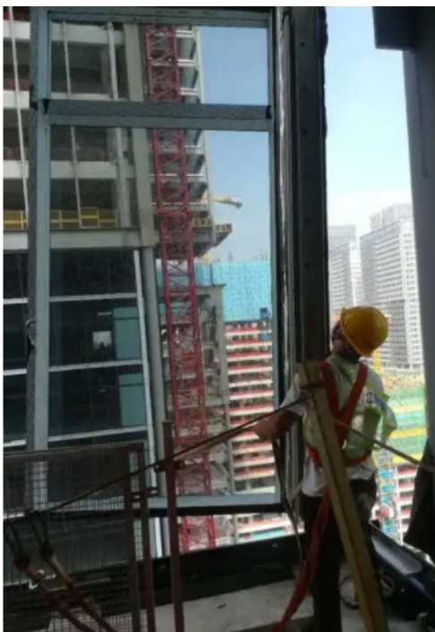
图2 移动式幕墙板吊装架

检测合格后,由施工单位、监理单位和甲方共同进行验收,签署验收报告。如果发现问题,应及时进行修补和整改,确保所有问题在验收前得到解决。完工验收合格后,还需进行保温性能的检测,确保保温系统达到设计的节能效果,从而保证外墙外保温系统的长期性能和安全性。