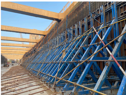
图 3 混凝土浇筑养护

混凝土浇筑后及时进行养护，养护时间不得低于 14 天且不低于设计图纸要求。侧墙养护采用薄膜覆盖，薄膜覆盖应连续，混凝土不得外露。