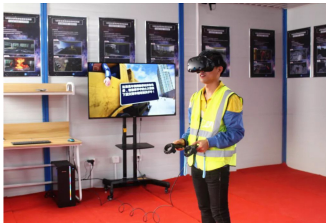
图2 利用VR技术加强安全教育培训和应急演练示例图

描得到相关操作指南和 safety 注意事项。如果运行混凝土搅拌机,则通过AR设备对该装置进行扫描,屏幕显示搅拌机内部结构,运行步骤动画和常见故障排除方法。在安全演练中,利用VR/AR技术对火灾,坍塌等多种安全事故的情景进行了仿真。在某道路施工项目的火灾演练中,通过VR技术营造逼真的火灾场景,包括烟雾、高温、火焰等,施工人员在虚拟环境中进行灭火、在疏散和其他作业中,该系统将对演练效果进行实时评价,并指出问题所在。通过此种沉浸式演练,施工人员可以较好地掌握应急处置技能和增强突发安全事故处理能力。