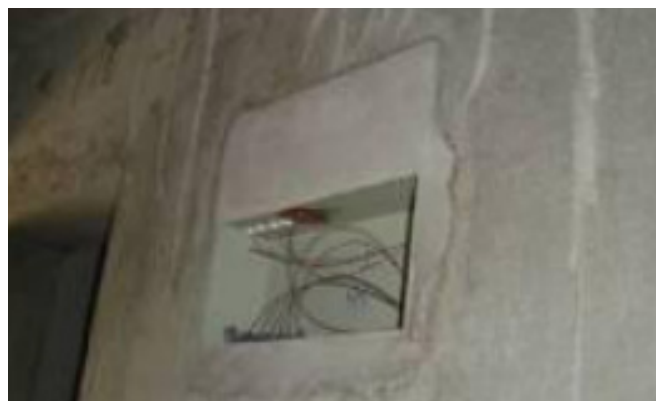
图1 电气箱体安装效果

气箱体可以在安装后形成最为理想的运行效果。如果在电气箱体安装时出现了变形现象，则需要及时选择专业工具进行修正，并且针对容易出现变形的部位进行内部支撑，避免持续出现变形问题。在电气箱体安装完成后，还应该针对周围抹灰工作进行精细化把控，确保抹灰边缘整洁光亮，避免存在较多的毛刺或者是较大缝隙，避免对电气箱体形成较大面积的糊盖问题，确保电气箱体的平整度以及水平度偏差均小于3mm。具体安装效果应该如下图1所示。