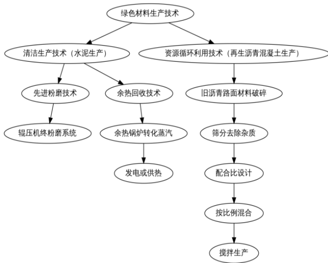
图1 绿色材料生产中清洁生产技术和资源循环利用技术流程图

资源循环利用技术也是绿色材料生产的关键技术之一。再生沥青混凝土的生产就充分体现了这一技术。利用特殊的粉碎装置,对回收沥青路面材料进行粉碎,使之达到产品质量标准。粉碎材料采用筛选装置筛分,除去其中的杂质及达不到粒度要求的颗粒。同时,依据老沥青的性质及新沥青、集料的性质,通过准确的配比设计,将新的沥青、集料等与老沥青、集料等按一定的配比进行配比,并添加一定数量的再生剂,在专用的拌和机中进行充分的搅拌,最终制备出综合性能优良的再生沥青混凝土。