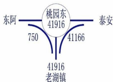
图1 桃园东枢纽互通式立交2043年转弯交通量