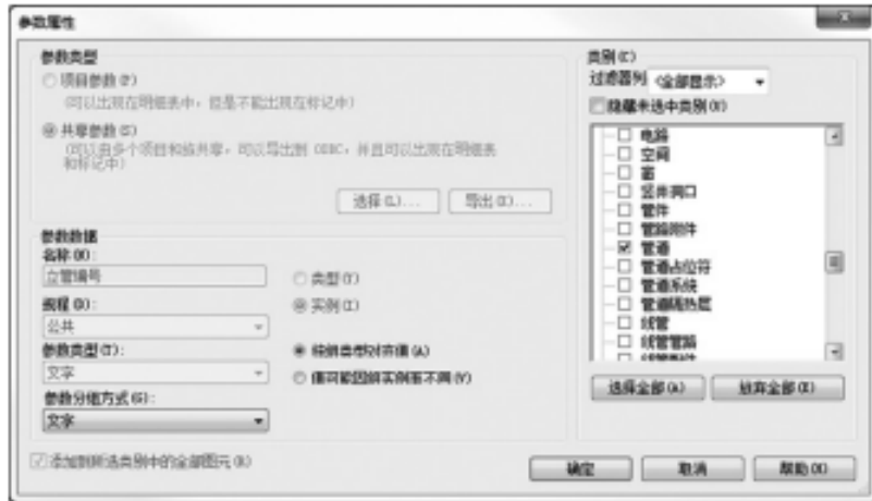
图 1 立管编号参数属性设置(计算机截图)

1. BIM 软件可创建管道标记族,按照管道设计信息将其录入到 BIM 系统之中,并根据设计表示进行管道设计整改,此时生成的管道图会自动标记可能出现碰撞的环节,与模型形成管理,对管道偏差进行改进。BIM 管道标记族可按照信息完成管径、管中心标高等诸多重要参数的标记设计,将横管和立管进行组合标记如此一来,同时设置管道编号(如图 1)。