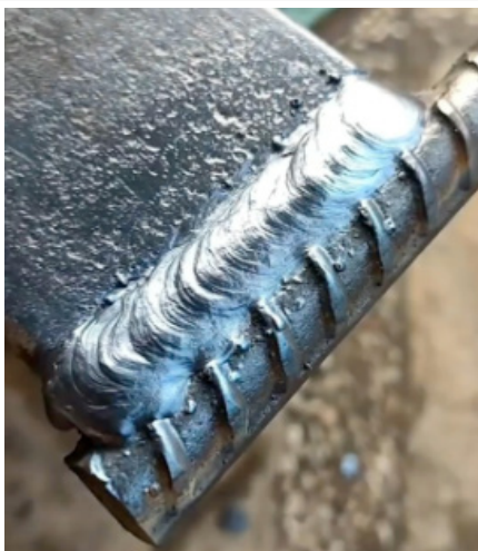
图 2 钢筋焊接质量标准示意图