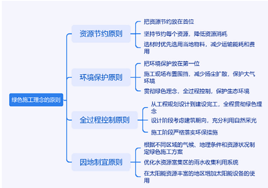
图 2 绿色施工理念的原则

是比较严重的，施工机械和车辆晚上违规操作，影响了居民的正常休息。污水排放同样缺少规范处理，没有经过净化就直接排放到市政管网或者周围水体中，含泥沙，化学药剂等破坏了水生态平衡，固体废弃物乱扔乱放、占地大、难降解等问题严重损害了周围的生态环境 [2] 。