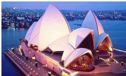
图 2 悉尼歌剧院

以悉尼歌剧院（见图2）为例，此公共建筑就通过别具一格的独特造型呈现，顺利成为悉尼极具标志性的地域文化符号。由于悉尼属于海滨城市，所以，此类公共建筑计划充分对当地海洋文化进行创新性转译，将壳体看作海洋文化的表达载体，统一设置为船只造型。而此种既有效呼应海洋文化主题，又突破传统建筑形式的设计思路，便顺利实现了视觉冲击力以及文化感召力的双赢 [2] 。