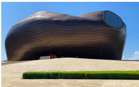
图 1 内蒙古鄂尔多斯博物院

以内蒙古鄂尔多斯博物院（见图1）为例，此类公共建筑就充分融入了蒙古包原型要素，在空间布局呈现方面，通过围合式空间设计高度契合蒙古族传统居民生活习惯置身于其中，人们能够快速产生熟悉感及安全感，促使自身内心深处所潜藏地对家乡的热爱之情得以觉醒。