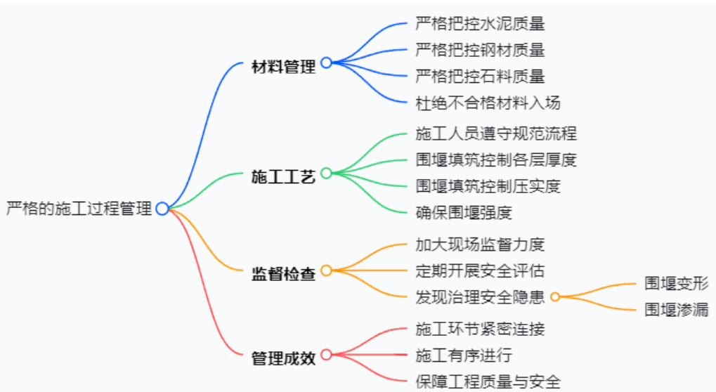
图 2 严格的施工过程管理

方面，对于用于导流建筑的各种原材料，例如水泥、钢材和石料等，都进行了严格的质量控制，确保不会有不合格的材料进入。施工工艺上，需要施工人员严格遵守既定的规范及流程，如围堰填筑过程中对各层的填筑厚度及压实度进行控制以确保围堰的强度。加大施工现场监督检查力度，定期开展导流建筑物安全评估工作，发现和治理如围堰变形和渗漏等安全隐患。通过严格的施工过程管理保证了导流施工各个环节的紧密连接和有序进行，保证了工程质量和安全（如图 2 严格的施工过程管理）。