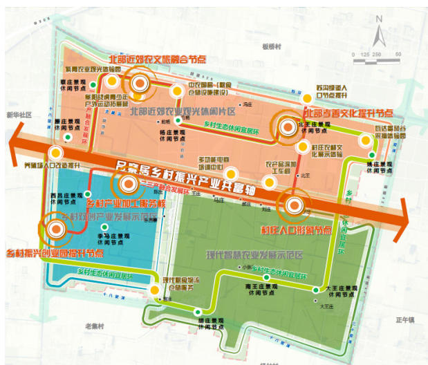
图5 总体规划结构图

合理规划乡村生产、生活和生态空间，构建科学合理的空间布局结构。规划形成“一轴双环、五核驱动、三区多点”的空间结构。一轴：吕寨居乡村振兴产业共富轴；双环：一二三产融合发展环9.5千米和乡村生态休闲宜居环12千米；五核：北部孝善文化提升节点、村庄入处形象节点、乡村产业加工服务核、乡村振兴创业园提升节点、北部近郊农文旅融合节点；三区：北部近郊农业观光休闲片区、乡村双创产业发展示范区、现代智慧农业发展示范区；多点：苏沟绿道入口节点提升、村庄农耕文化展示体验、农产品深加工车间、多功能电商培训中心、养殖场入口改造提升、紫青农业观光体验园、阜阳战虎青少年户外运动拓展营中农国昌（粮食仓储设施建设）。