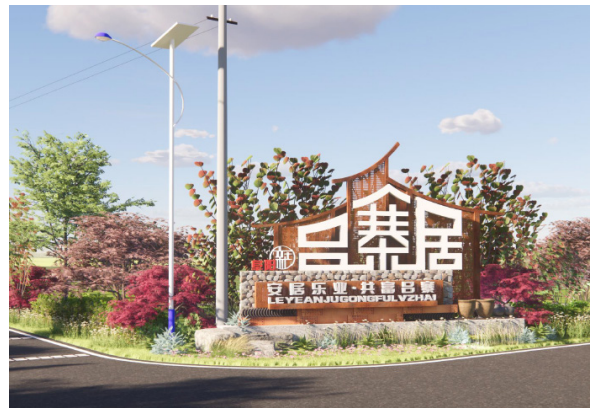
图 4 村庄入口景观形象标识

规划聚焦沟塘治理工程、绿化美化工程、道路提升工程三个方面提升人居环境。沟塘治理工程：提出5公里沟塘治理计划，对北横沟、吕草沟等进行清淤疏浚长，同时对岸边绿化、莲藕等水生植物种植、乡土鱼种放养。绿化美化工程：实施北横沟、吕草沟2条水环境提升；中心路、吕草路、蔡李路、十八里河北段、乡村休闲慢步道5条道路景观提升；5处道路交叉口景观提升；1条沿路村庄立面提升，涉及8个自然村；N处五小园建设。保障村庄绿化覆盖率不低于40%的，通村主干道、村内主河道绿化率达90%。新增村庄2处门户标识和10处一般标识。道路提升工程：规划拓宽5条主要道路，长度约10公里，保障村内道路路宽不低于3.5米，路面采用水泥、沥青硬化或黑化。并新增9处公共停车场，同时对5条道路进行亮化提升。