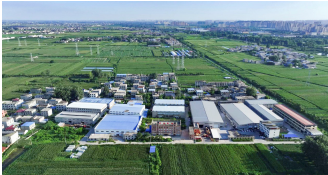
图 2 村庄现状图

村内居住整体呈现出“大散居，小聚集”的特点，存在沿道路建设村庄的特征，村庄体量较小，组团式发展。其整体景观风貌不统一，村落入口门户空间、道路沿线和庭院景观亟待提高。