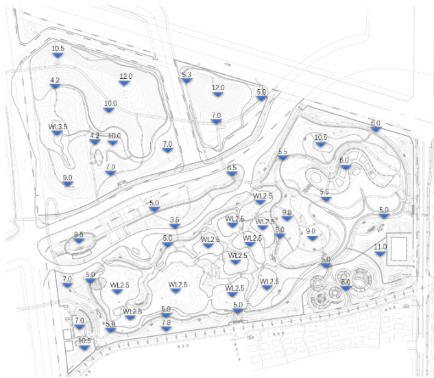
图 2 竖向设计平面图

场地内的设计标高在 4.0 ~ 12.0m 之间，以北高南低的整体格局，形成北面山地，南面湿地的空间关系，北面山地地形起伏变化较大，由水边逐渐向山坡延伸，设计标高为 5.0 ~ 12.0m；南面有大面积的湿地，设计标高为 4.0 ~ 7.5m，小面积坡地丛林，设计标高为 9.0 ~ 11.0m。竖向设计图如图 2 所示。