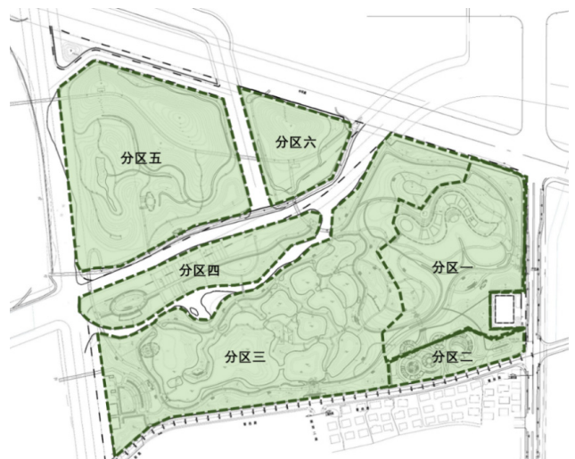
图 3 排水分区平面图

根据景观竖向设计及水系等条件，将整个片区划分为 6 个汇水分区，如图 3 所示。分区二靠近市政路入口处，由于竖向标高的限制，径流雨水经有组织收集后就近接入市政管网系统。其他区域地表径流经有组织收集后，就近排入干塘或者湿地等滞蓄型海绵设施。