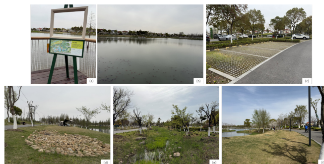
图 5 实施后现场实景：净化湿地科普标牌(a)；净化湿地(b)；生态停车场(c)；雨水花园(d)；干塘(e)；植草沟(f)

本项目构建了湿地—林地复合栖息地，为高密度城市营造多功能生态空间，集生态保育、休闲游憩及文化科普功能于一体。通过景观设计与海绵城市低影响开发技术的深度融合，既强化了绿地系统的生态服务功能，又提升区域生态质量与居民生活品质。建设后实地效果见图 5。