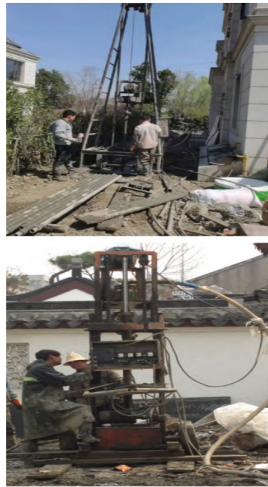
图2 钻孔施工示意图

工空间。根据设计要求和空调的布置方案，确定钻孔位置，同时根据钻孔设计深度利用垂直钻孔的方式，逐渐向下钻孔。钻孔期间需要做好钻头的持续清理工作，避免钻头附近大量破碎物堆积影响后续钻孔的稳定性。其次是进行钻孔管安装。在钻孔作业完成后，在钻出孔道处安装钻孔管，其间需要注重孔道内壁的稳定性，避免产生坍塌问题。最后是进行后封孔处理。在钻孔管安装完毕后，将水泥浆和其他密封材料注入孔道，将其进行完全填筑，确保孔道封堵的完整性与密封性。在钻孔施工过程中，需要做好全过程的质量控制，对孔道内壁的坚固度、钻孔推进速度和钻孔质量进行全方位控制，确保钻孔符合设计要求。包括钻孔位置的准确性、钻孔直径控制和钻孔深度控制等，如图2所示。