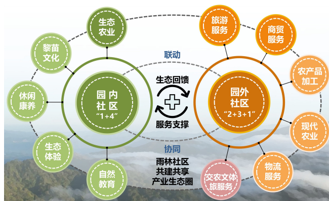
图1：雨林公园社区产业发展思路示意图

休闲康养。国家公园拥有壮丽的自然景观、清新的空气、纯净的水源等，为开展森林康养、负氧疗养、运动健身等休闲康养活动提供了良好的条件，是远离城市喧嚣、放松身心、恢复健康的理想去处。因此，园内社区可以谋划“大康养+大休闲”主题产业项目，加快推动休闲娱乐、康养修身等多业态融合发展的模