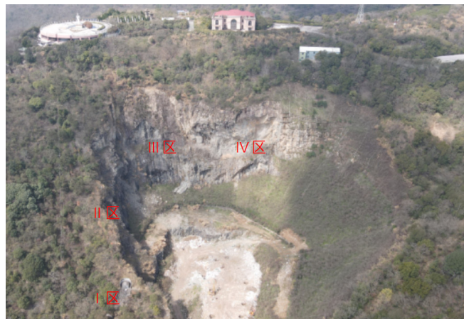
图 1 废弃岩坑治理分区图

平台上。在塔架与山体之间设置支撑结构, 中部设置 6 道横向支撑, 上部设置廊桥连接, 竖向设置 2 道支撑, 以加强对塔架结构的约束, 提高结构的抗侧移刚度。